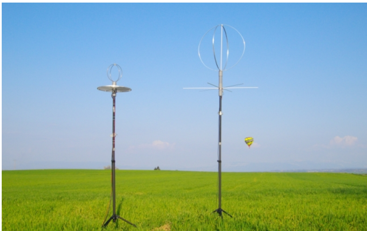
ON6WG – F5VIF/P ~ Antennes "Eggbeater" UHF / VHF